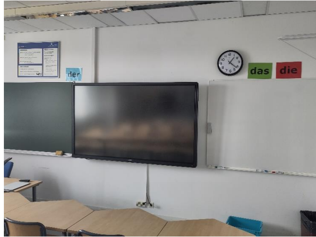
Abbildung 2: Klassenzimmer mit tech. Ausstattung